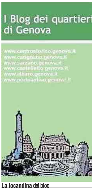
La locandina del blog