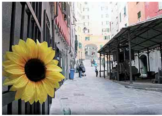
Lo scorcio di Santa Brigida