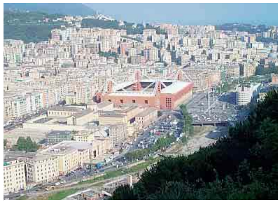
La vista sul Ferraris

LA STORIA ❖ Nel 2006 è nato quello di Sarzano, poi altri quattordici